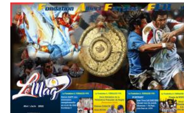
Le Mag n°31