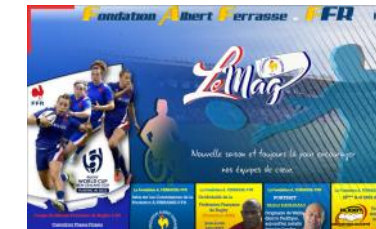
Le Mag n°32