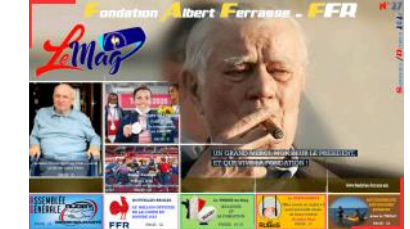
Le Mag n°27