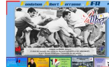
Le Mag n°28