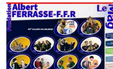
Le Mag n°34