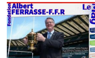
Le Mag n°35