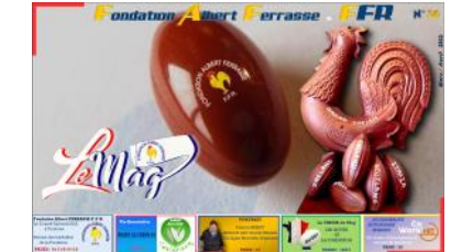
Le Mag n°30