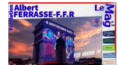
Le Mag n°36