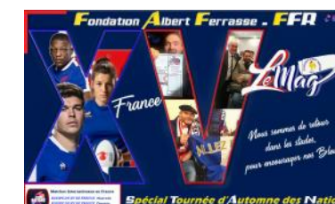
Le Mag n°H-S 2021