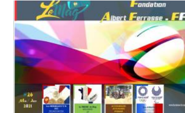
Le Mag n°26