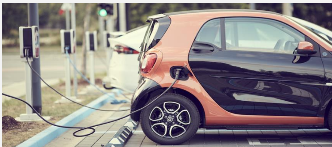
Les places accessibles avec borne de recharge électrique sont plus larges que les places ordinaires : 3,3 m, comme les places réservées aux titulaires de la CMI-stationnement, au lieu de 2,3 m

Un récent arrêté dispose que 10 à 30 % des places de stationnement équipées de dispositifs de recharge pour véhicules électriques doivent respecter les normes d'accessibilité. C'est bien plus que les 2 % de places de stationnement sur le domaine public réservées aux titulaires de la CMI-stationnement. Mais ces emplacements avec borne électrique seront ouverts à toutes les voitures, pas seulement à celles transportant des personnes handicapées.