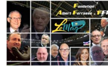
Le Mag n°25