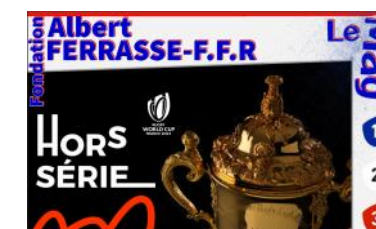
Le Mag n°H-S 2023 Coupe du Monde 2023