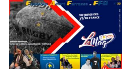
Le Mag n°33