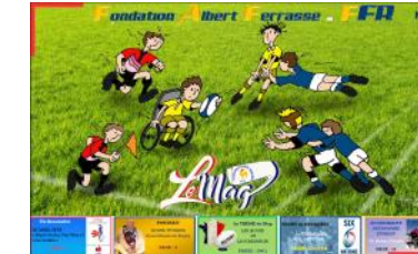
Le Mag n°29