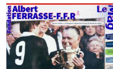
Le Mag n°37