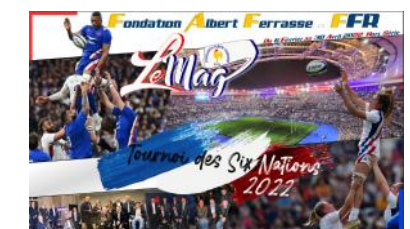
Le Mag n°H-S 2022